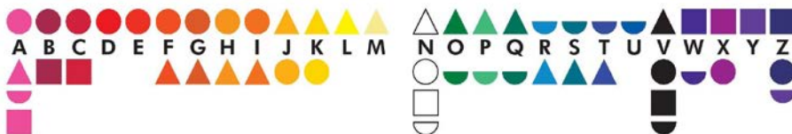
L'alphabet plastique d'Auguste Herbin